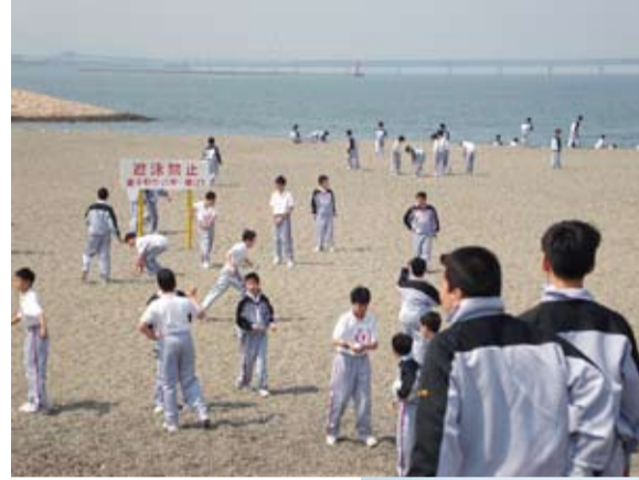
学校とは違う雰囲気の中みんなと遊ぶ