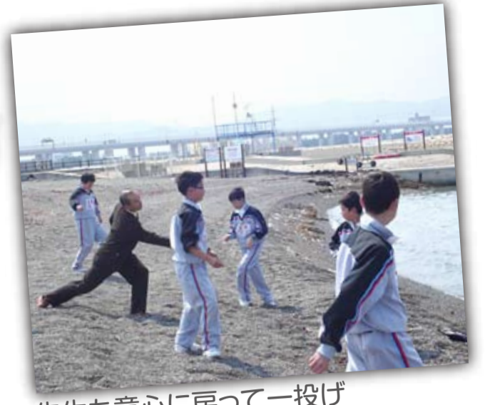
先生も童心に戻って一投げ

中学一年生が校外学習で訪れたのは関西国際空港と二色ノ浜公園。関西国際空港ではデッキの上から見学。いろんな国の航空機が行き交う様はまさにここが世界に繋がっていることを感じ取ることができ、また、対岸にある二色ノ浜公園ではのんびりとしたひとときを過ごすことができました。