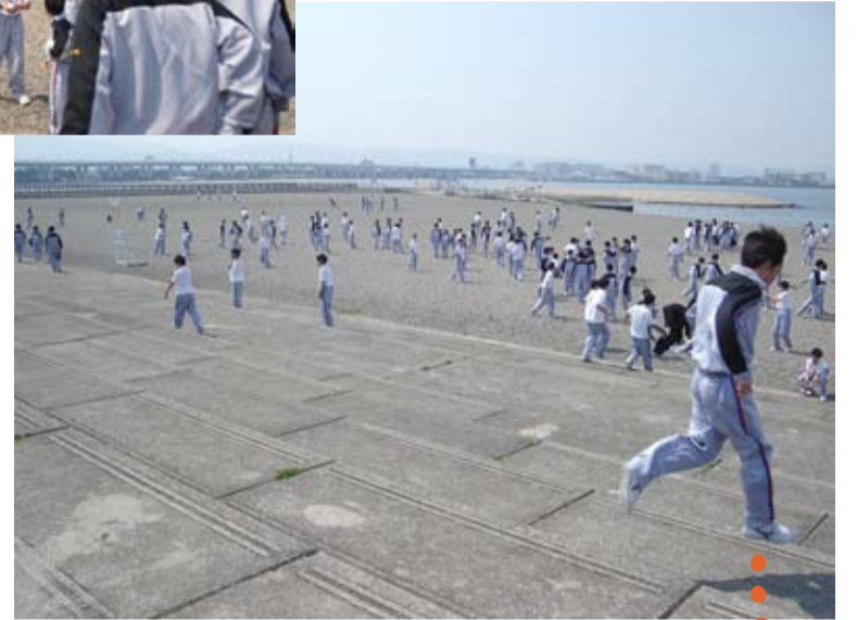
よく整備された公園でおもしろいひとときを過ごしました